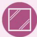
アルミ樹脂複合サッシ Low-E複層ガラス